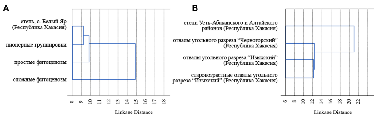
Рис. 2. Сходство флор отвалов угольных разрезов Хакасии на разной стадии сукцессии ( А ) и разного географического положения ( В ) с флорой степей.

Флористический состав отвалов разрезов «Черногорский» и «Изыхский» сходен (Рис. 2В). На отвалах разреза «Черногорский» выявлено 175 видов растений, что связано с более засушливыми условиями; на отвалах разреза «Изыхский» и старовозрастном отвале «Изыхский» обнаружено соответственно 205 и 213 видов.