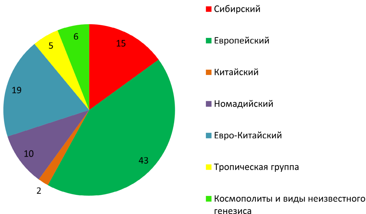
Рис. 3. Фауногенетическая структура гнездовой фауны птиц Ашинского заказника.

димости его внесения в региональную Красную книгу с категорией III (Гашек и Красуцкий, 2021; Гашек и др., 2022). Выводок из 4 или более птенцов встретили 12 июля 2021 г. в месте слияния рек Аши и Мал. Аши на юго-западной границе заказника. Пару без выводка наблюдали в июне 1996 г. на Миньярском пруду (в то время – южные окрестности заказника).